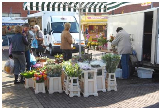
Markt in Beneden-Leeuwen

Gemeente West Maas en Waal wil een helpende hand reiken naar onze ondernemers door de rode loper uit te rollen. De afgelopen jaren hebben we dan ook niet stil gezeten. In hoofdstuk 3 vindt een korte evaluatie plaats van de vorige Economische nota 2013 – 2015.