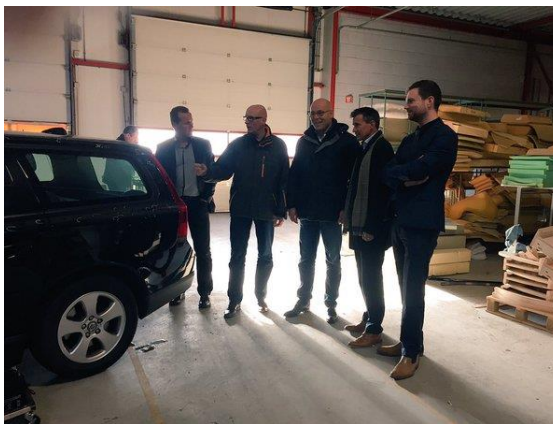
Collegebezoek aan Van Dijk autoschade