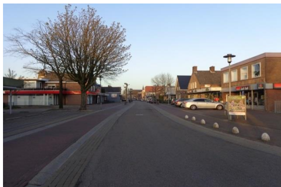
Zandstraat in Beneden-Leeuwen

De voorzieningen in de kleine kernen lopen terug. Kleine supermarkten / dag winkels kunnen hun hoofd niet meer boven water houden of hebben geen opvolger. De gemeente kan hierin zoveel mogelijk informeren en faciliteren, maar financieel helpen is er niet bij. Om de voorzieningen op peil te houden kan worden gekeken naar alternatieven. Hierbij valt te denken aan een zelfvoorzienende markt of andere alternatieven.