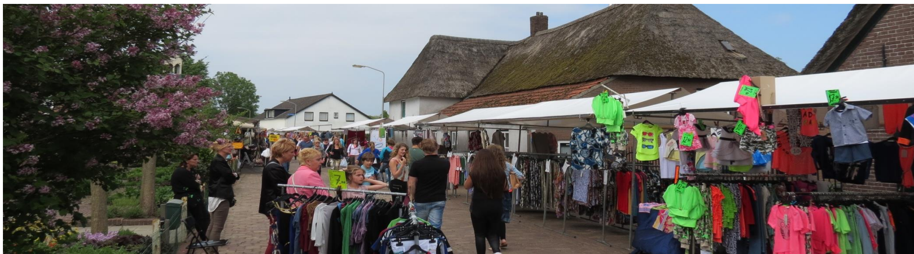
Jaarlijkse PinksterVaria in Altforst