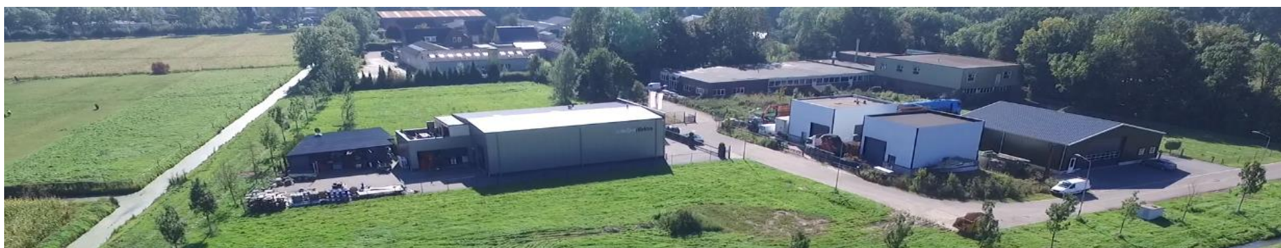
Bedrijventerrein Kapelstraat in Maasbommel