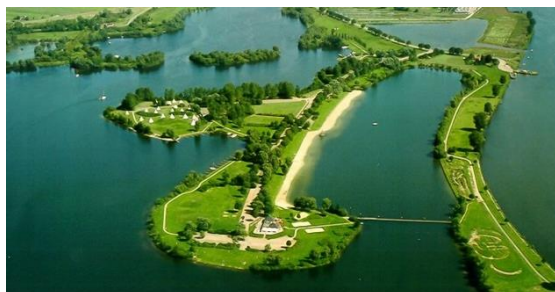
Recreatiegebied De Gouden Ham

Deze activiteiten zullen bijdragen aan het realiseren van onze recreatieve doelstellingen: meer overnachtingen, bestedingen, werkgelegenheid en een betere samenwerking tussen ondernemers en gemeente.