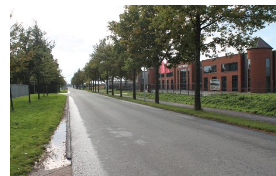
Veesteeg in Beneden-Leeuwen/Boven-Leeuwen

Nijmegen en 's-Hertogenbosch binnen een half uur te bereiken. Echter, het openbaar vervoer is in mindere mate aanwezig in onze gemeente. Vanaf de Waaldorpen is er een busverbinding voorhanden en voor zes van de acht dorpen een buurtbus. Gezien bereikbaarheid een steeds belangrijker punt wordt door de vergrijzing, zal hier in de toekomst beter in moeten worden voorzien. Hierbij zal een betere bereikbaarheid ook een positief effect hebben op de vrijetijdseconomie in onze gemeente.