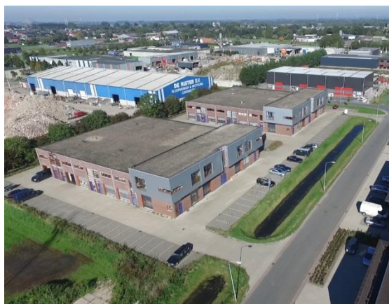
Bedrijventerrein Veesteeg Oost in Boven-Leeuwen

detailhandelsstructuren in onze gemeente. Deze lokale herijkte nota is de kapstok voor het uitvoeringsprogramma wat eveneens in dit document is ingesloten. Het uitvoeringsprogramma is besproken met de ondernemers om meer draagvlak te genereren en om informatie in te winnen. Weten wat er in het veld speelt, is belangrijk bij een goede uitvoering.