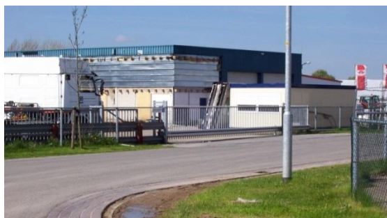
Bedrijventerrein Lageweg in Dreumel

Er is een marketingcampagne opgezet om de bedrijventerreinen meer onder de aandacht te brengen. Hierbij is gebruik gemaakt van een promotiefilm die via een USB, social media en e-mail onder de aandacht wordt gebracht. Op het bedrijventerrein Veesteeg Oost blijven we ondanks de economische crisis structureel kavels verkopen. In 2015 hebben we twee kavels verkocht van in totaal 4.063 m 2 . De bedrijventerreinen in Dreumel en Maasbommel blijven hierbij achter. Momenteel wordt er met verschillende artikelen geadverteerd in het blad IN2MAASENWAAL en grote verkoopborden voor de bedrijventerreinen zijn in ontwikkeling. Naast de bedrijventerreinen die de gemeente in ontwikkeling heeft, zijn er ook twee bedrijventerreinen in ontwikkeling door derden. Dit zijn de bedrijventerreinen Veesteeg West en De Krozenbogerd (woon en werklocatie), allebei in Beneden-Leeuwen.