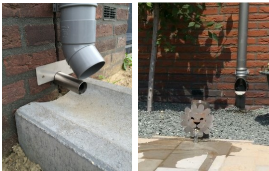
Via spouwmuur en goot.