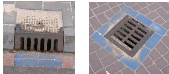
Blauwe rand betekent: alléén voor regenwater

Een put met een blauwe rand is dus alleen bedoeld voor regenwater, en niet voor emmers sop, olie, afval, of verfresten want dat komt dan ook in de sloot.