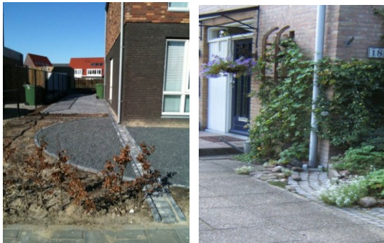
Voorbeelden van bovengrondse afvoer via gootjes.

Bij nieuwbouw gaat de gemeente anders om met het regenwater. Dit beleid staat beschreven in het afkoppelbeleidsplan. U bent verplicht het regenwater te scheiden van het afvalwater en (semi) bovengronds te laten afstromen naar de straat of sloot.